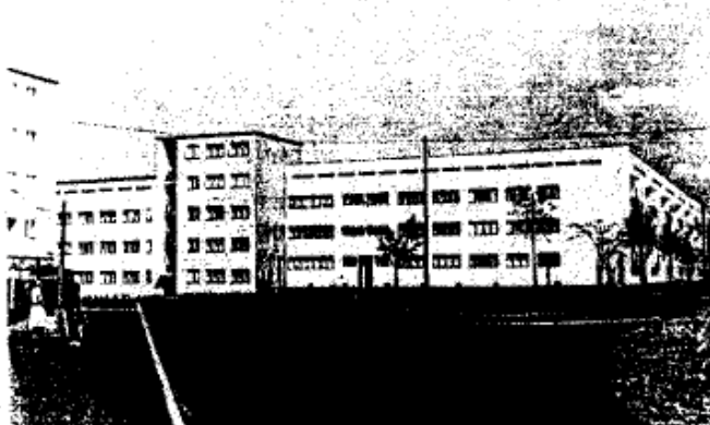
Wohnungsbauten der GEWOBAG, Blick in die Kopernikusstraße